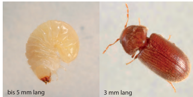
bis 5 mm lang

Häufig in gelagertem Getreide, Getreideprodukten, Nüssen, Trockenobst und Fruchtttees, Sämereien, Tierfutter