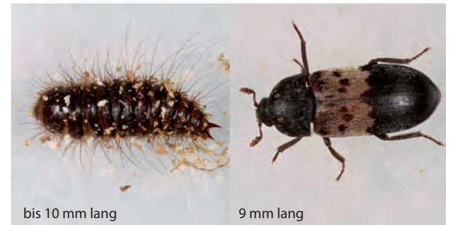
bis 10 mm lang

Häufig in Mehl, Grieß oder ganzen Getreidekörnern