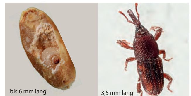
bis 6 mm lang

Häufig in Produkten mit tierischen Anteilen (z. B. Trockenfutter für Haustiere)