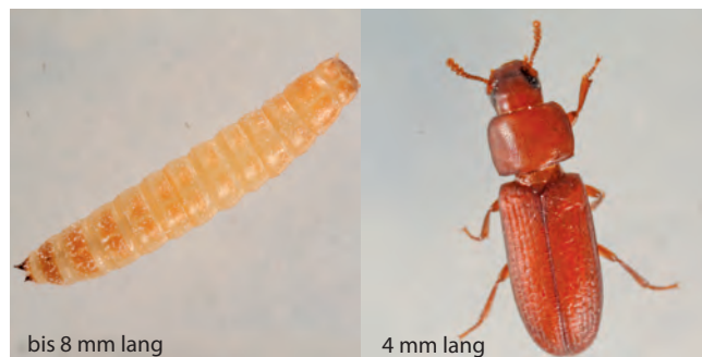
bis 8 mm lang

Häufig an Getreideprodukten (Knäckebrot, Nudeln), Gewürzen, Arzneipflanzen